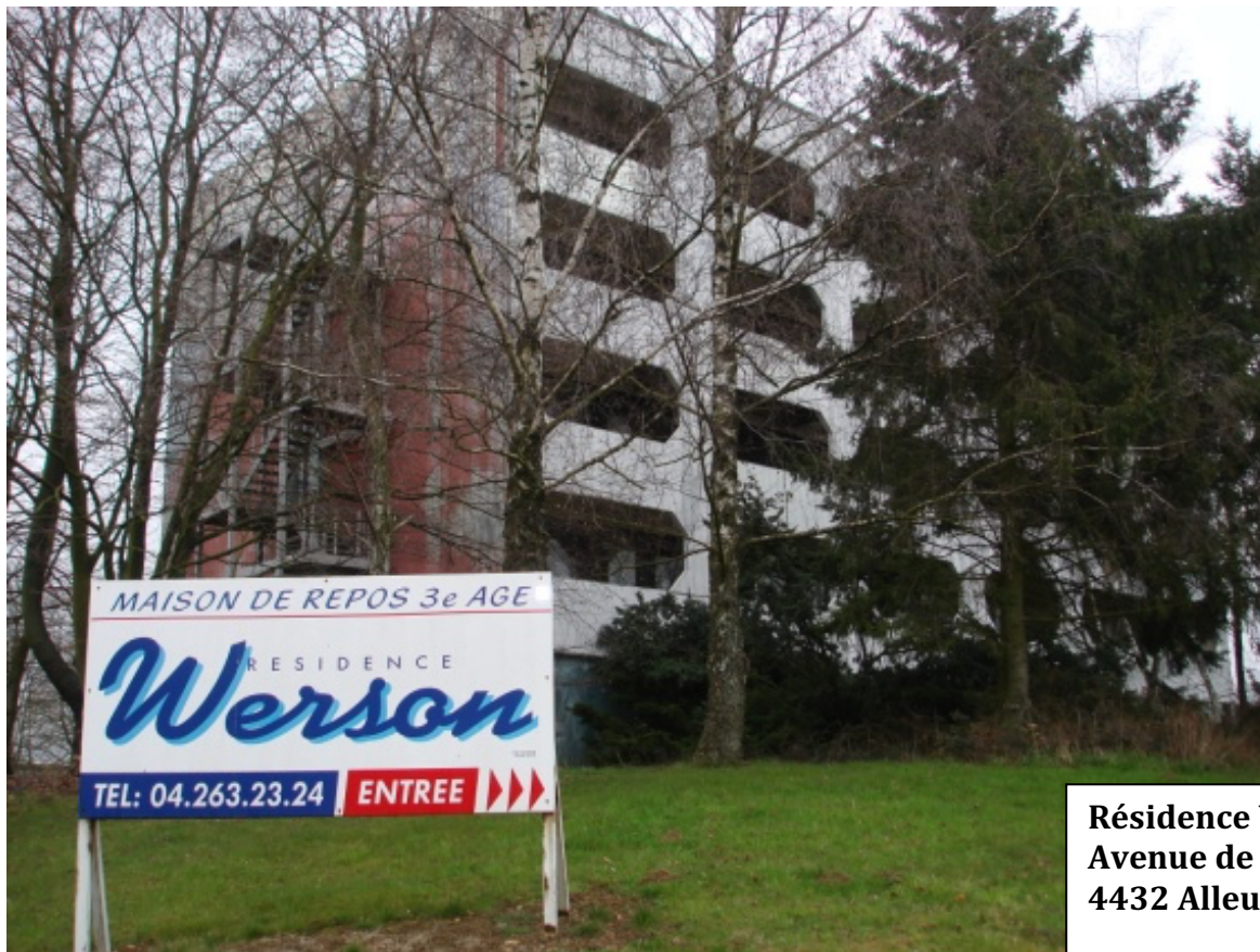
Résidence Werson Avenue de l'énergie, 22. 4432 Alleur