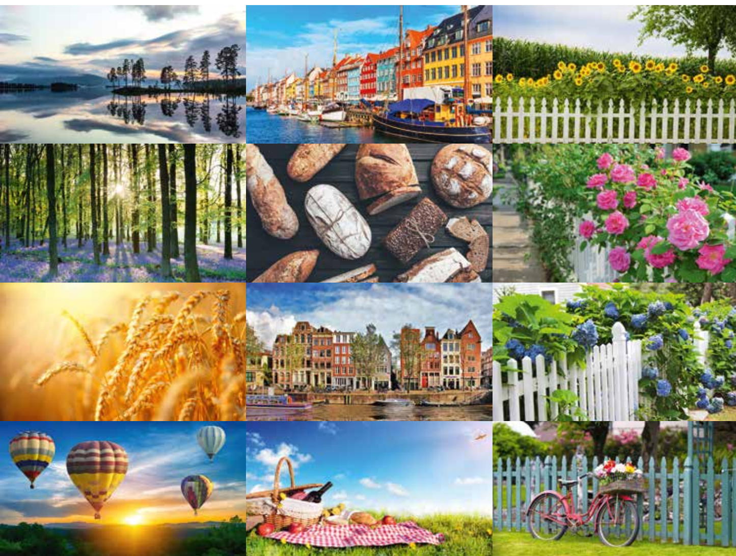
Relaxing, Remembering, Protecting – hierboven ziet u slechts enkele voorbeelden van de afbeeldingen uit ons online fotoarchief.