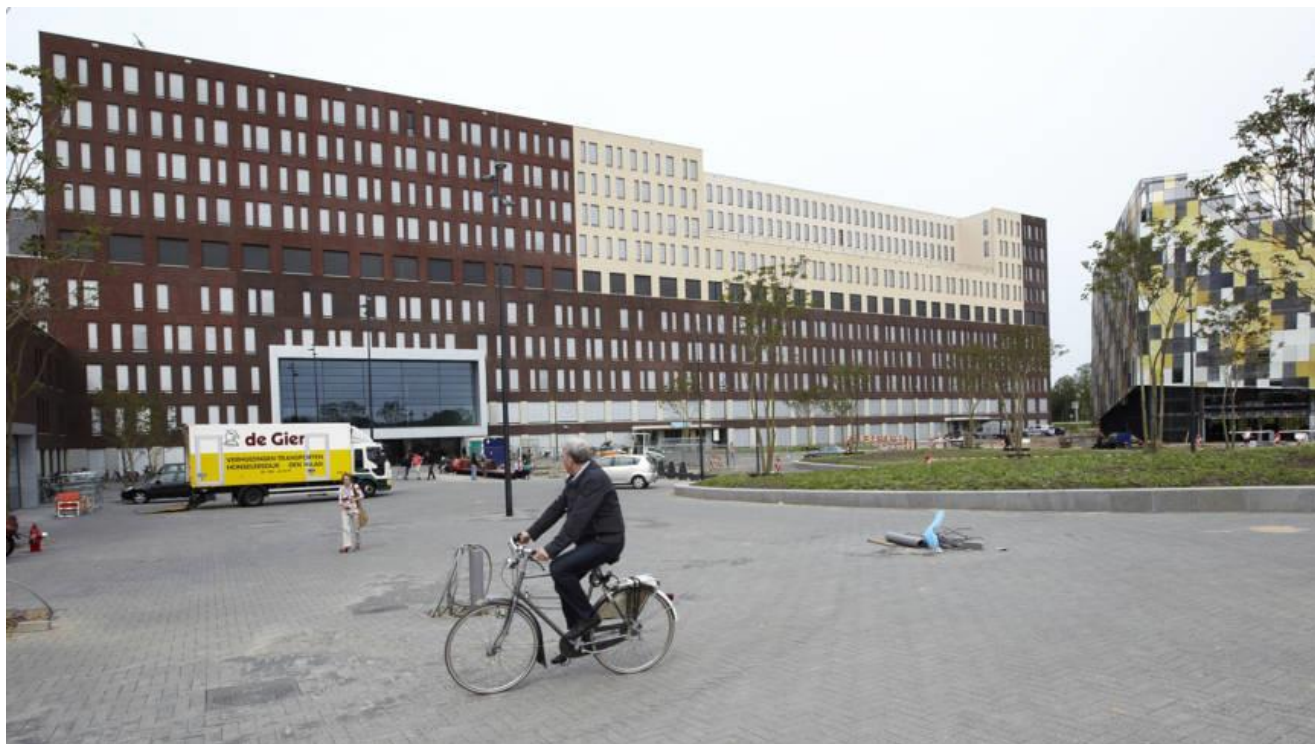
Het nieuwe gebouw van het Jeroen Bosch Ziekenhuis in Den Bosch

In het Jeroen Bosch Ziekenhuis in Den Bosch blijken nog eens acht patiënten besmet te zijn met de klebsiella-darmbacterie. Die kan bij verzwakte mensen ontstekingen veroorzaken en is ongevoelig voor de meeste antibiotica. Afgelopen maandag werd al bekend dat vorige week bij acht patiënten een besmetting met klebsiella is ontdekt. Daarop besloot het ziekenhuis om alle 760 patiënten te controleren. Eind deze week zijn alle resultaten bekend, maar uit deze groep zijn nu al zes nieuwe besmettingen naar voren gekomen. Ook is er nog een besmetting vastgesteld bij twee andere mensen, die al thuis waren toen het onderzoek begon.